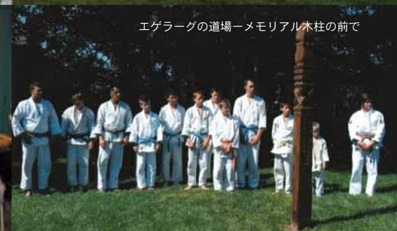
エゲラーグの道場—メモリアル木柱の前で