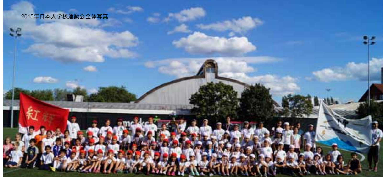
2015年日本人学校運動会全体写真