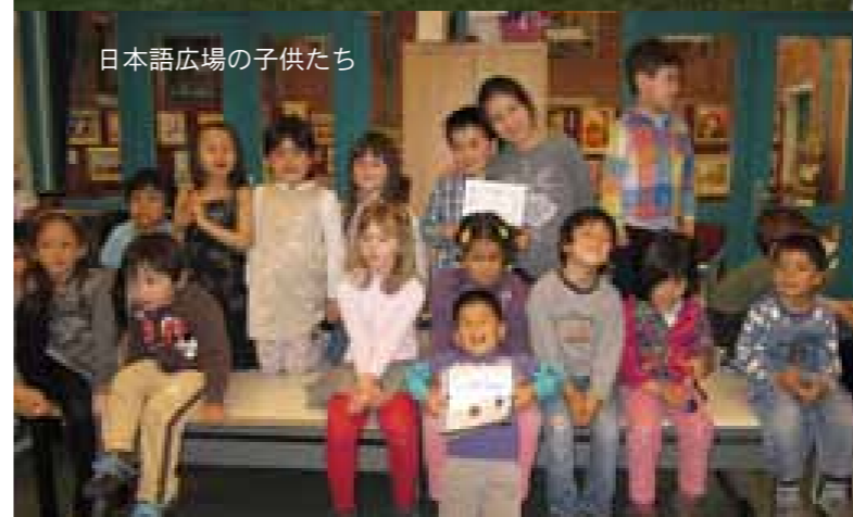
日本語広場の子供たち