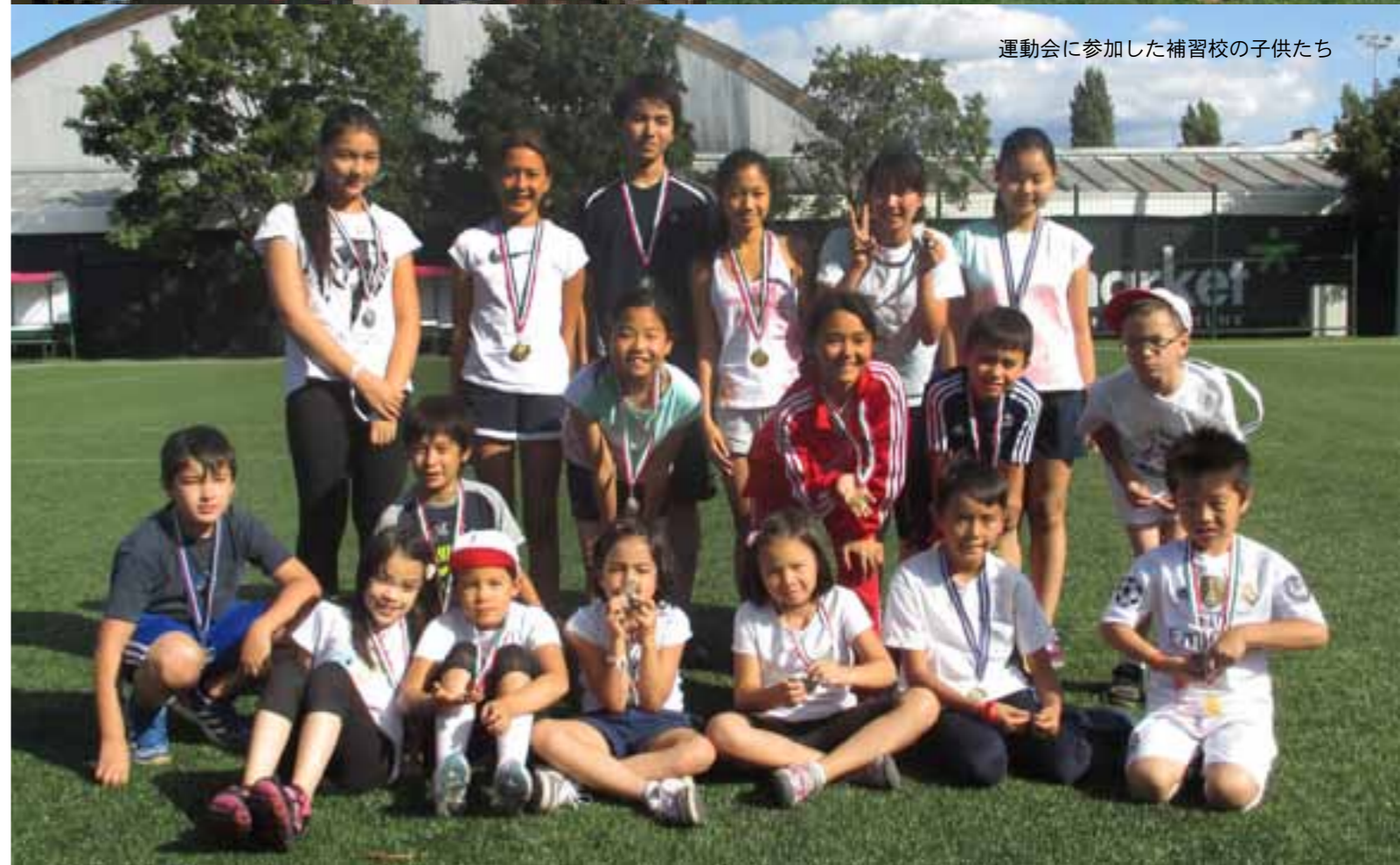
運動会に参加した補習校の子供たち